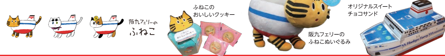
ふねこのおいしいクッキー オリジナルスイートチョコサンド 阪九フェリーのふねこぬいぐるみ