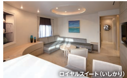
ロイヤルスイート(いしかり)