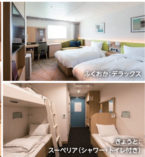
ふくおか：デラックス きょうと：スーペリア(シャワー・トイレ付き)