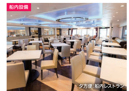
夕方便:船内レストラン

夕食朝食共にバイキング形式にてご提供しています。北海道や茨城県の食材を活かしたお料理を取り揃え、季節ごとのメニューもご用意しております。※メニューや提供方法は予告なく変更になる場合がございます。