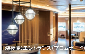
深夜便:エントランス(プロムナード)