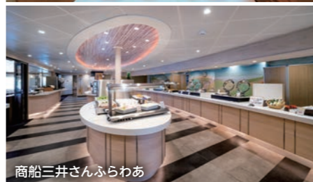
商船三井さんふらわあ