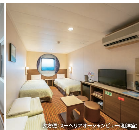
夕方便:スーパーリアオーシャンビュー(和洋室)