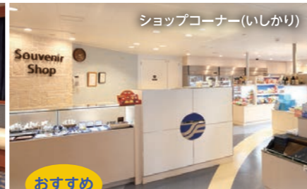
ショップコーナー(いしかり)

「いしかり」就航15周年を迎えました。 船内では、和洋折衷の美食バイキング、就航地のお土産やオリジナルグッズ等を取り揃えたショップ、大海原を望む展望大浴場など、充実した施設でお客様をおもてなしいたします。さらに、ラウンジでは様々なジャンルのアーティストによる本格的な演奏(いしかり・きそ)、映画上映が、旅の思い出を彩ります。日本最長航路を誇る太平洋フェリーで、心安らく優雅な船旅をご堪能ください。