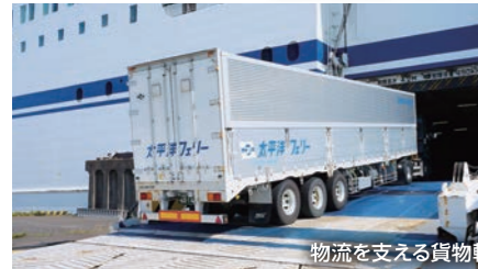
物流を支える貨物輸送