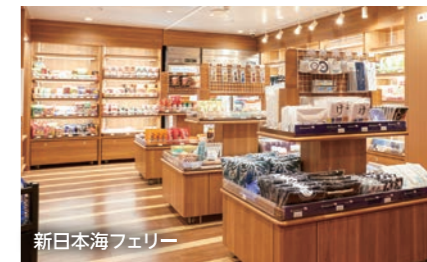
新日本海フェリー