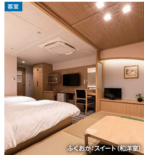
ふくおか：スイート(和洋室)