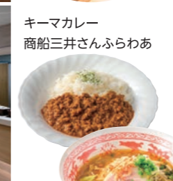
えび味噌ラーメン 新日本海フェリー