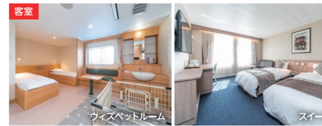
客室 ウィズペットルーム スイート