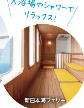
新日本海フェリー