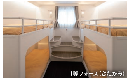
1等フォース(きたかみ)