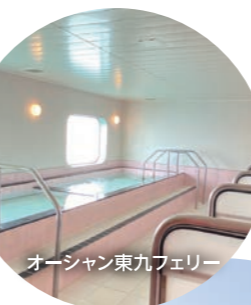
オーシャン東九フェリー