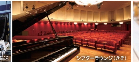
シアターラウンジ(きそ)