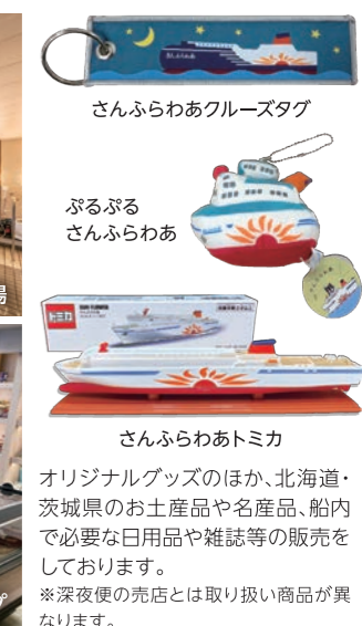
さんふらわあクルーズタグ