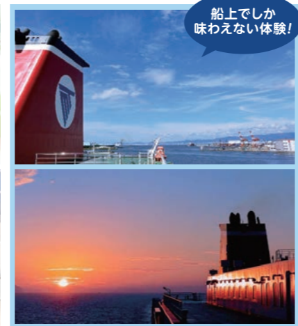
船上でしか味わえない体験!

【設備についての注意事項】設備は就航船により異なる場合がございます。詳しくはHPをご覧ください。