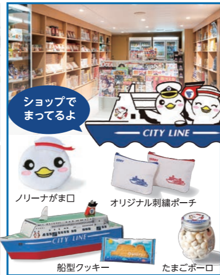
ショップでまってるよ ノリーナがま口 オリジナル刺繍ポーチ 船型クッキー たまごボーロ