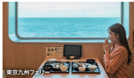
東京九州フェリー