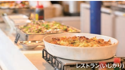
レストラン(いしかり)