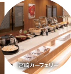
宮崎カーフェリー