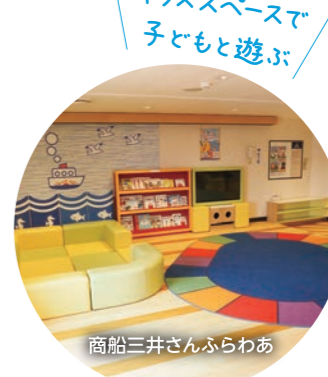
商船三井さんふらわあ