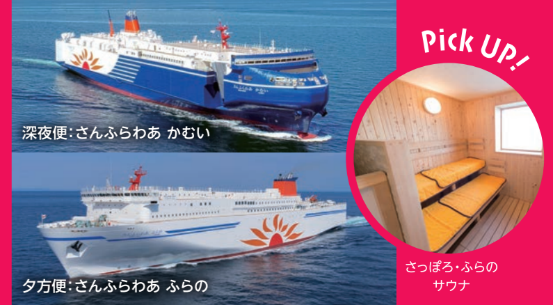
深夜便:さんふらわあ かむい

夕方便の「さんふらわあ さつぱろ」「さんふらわあ ふらの」は大海原を臨むレストランや展望浴場を完備。深夜便には環境に優しいLNG燃料フェリー「さんふらわあ かむい」、「さんふらわあ ぴりか」が就航しました。