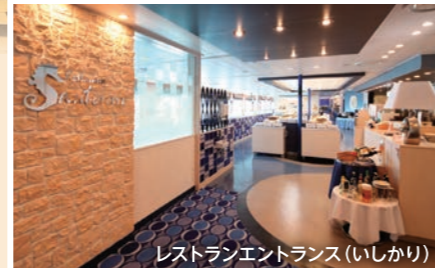
レストランエントランス(いしかり)

オリジナルワイン(赤・白) 1,800円(税込) オリジナルトートバッグ 600円(税込)