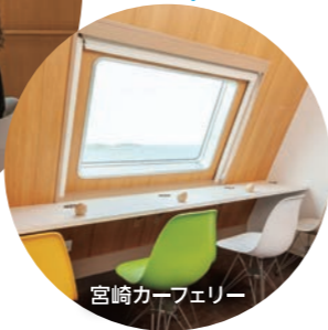
宮崎カーフェリー