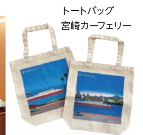
トートバッグ 宮崎カーフェリー