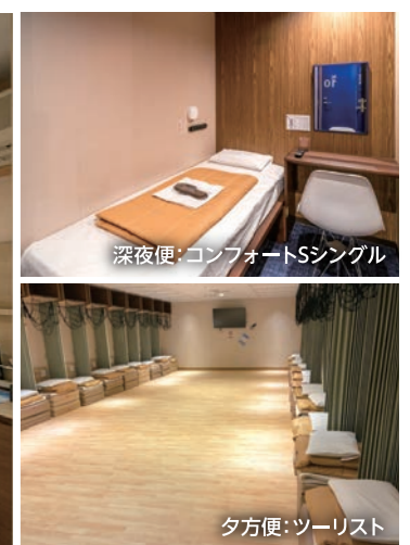
夕方便:ツーリスト