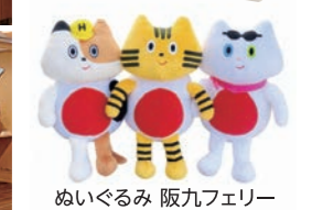
ぬいぐるみ 阪九フェリー