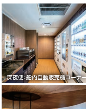
深夜便:船内自動販売機コーナー

夕食朝食共にバイキング形式にてご提供しています。北海道や茨城県の食材を活かしたお料理を取り揃え、季節ごとのメニューもご用意しております。※メニューや提供方法は予告なく変更になる場合がございます。