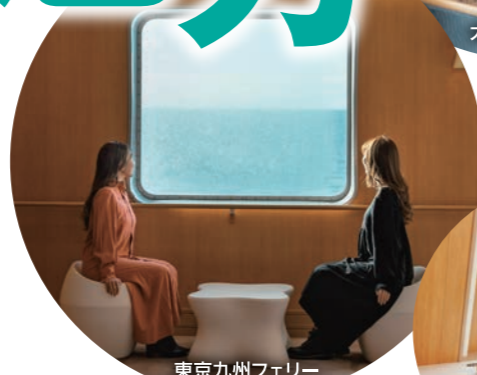
東京九州フェリー