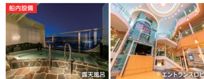
露天風呂 エントランスロビー