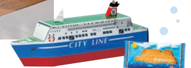
オリジナル船型クッキー 名門大洋フェリー