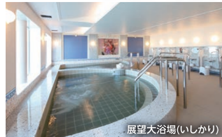
展望大浴場(いしかり)

「いしかり」就航15周年を迎えました。 船内では、和洋折衷の美食バイキング、就航地のお土産やオリジナルグッズ等を取り揃えたショップ、大海原を望む展望大浴場など、充実した施設でお客様をおもてなしいたします。さらに、ラウンジでは様々なジャンルのアーティストによる本格的な演奏(いしかり・きそ)、映画上映が、旅の思い出を彩ります。日本最長航路を誇る太平洋フェリーで、心安らく優雅な船旅をご堪能ください。