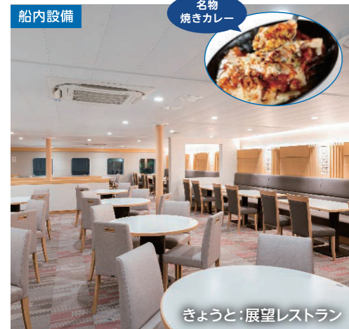
名物 焼きカレー きょうと：展望レストラン