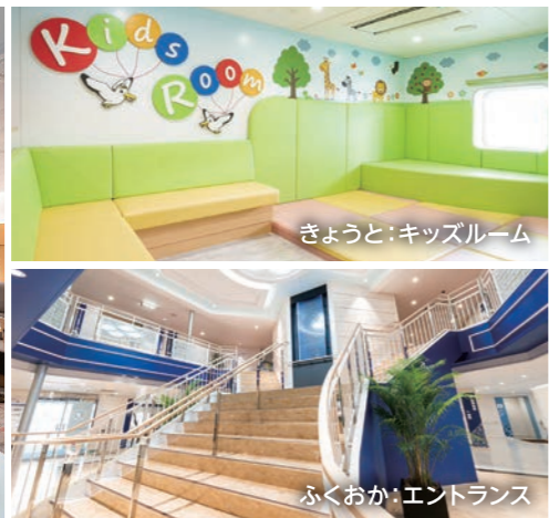
きょうと：キッズルーム ふくおか：エントランス