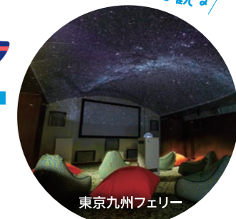
東京九州フェリー