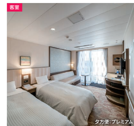
夕方便:プレミアム

【設備についての注意事項】設備は夕方便・深夜便で異なります。詳しくはHPをご覧ください。