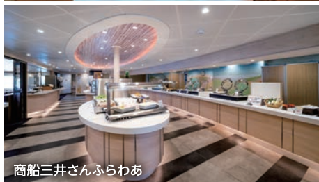
商船三井さんふらわあ