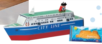
オリジナル船型クッキー 名門大洋フェリー