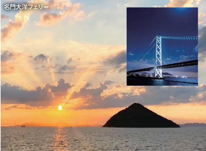
名門大洋フェリー