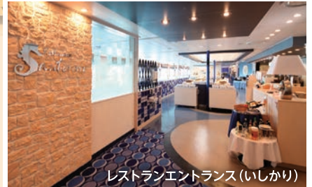
レストランエントランス(いしかり)

船内では、和洋折衷の美食バイキング、就航地のお土産やオリジナルグッズ等を取り揃えたショップ、大海原を望む展望大浴場など、充実した施設でお客様をおもてなしいたします。さらに、ラウンジでは様々なジャンルのアーティストによる本格的な演奏(いしかり・きそ)、映画上映が、旅の思い出を彩ります。日本最長航路を誇る太平洋フェリーで、心安らぐ優雅な船旅をご堪能ください。