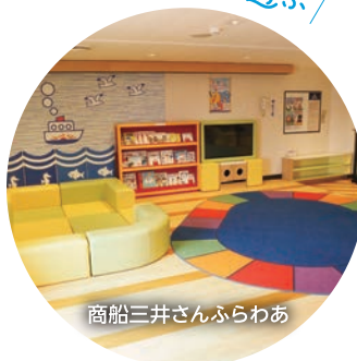
商船三井さんふらわあ