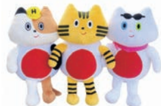
ぬいぐるみ 阪九フェリー