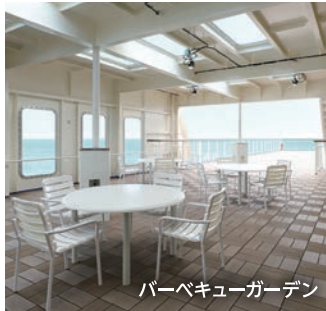
バーベキューガーデン