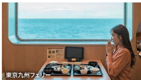
東京九州フェリー