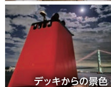
デッキからの景色