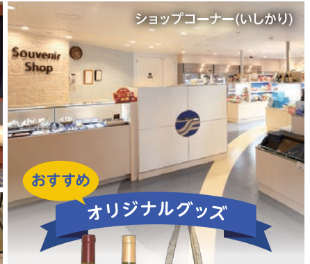
ショップコーナー(いしかり)