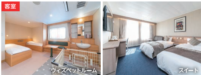
ウィズペットルーム