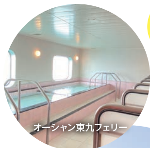
オーシャン東九フェリー