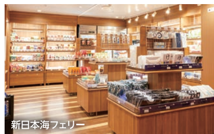
新日本海フェリー