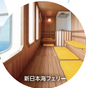
新日本海フェリー