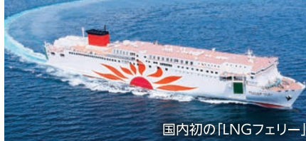
国内初の「LNGフェリー」

ユニバーサル・スタジオを代表とするテーマパークから、ショッピング、観光が楽しめる関西一の大都会 大阪と、温泉と情緒のあるまち・別府を結ぶ航路です。国内初の「LNGフェリー」 「さんふらわあ くれない」「さんふらわあ むらさき」が就航しています。