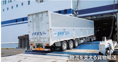
物流を支える貨物輸送