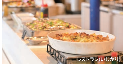
レストラン(いしかり)