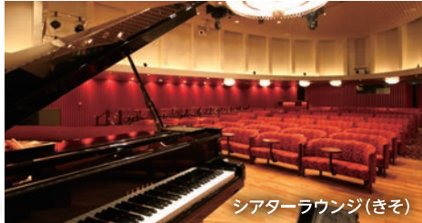
シアターラウンジ(きそ)