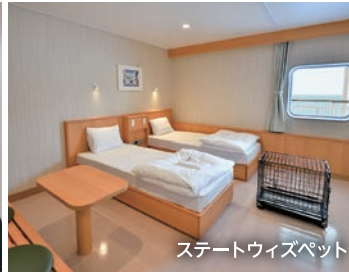
ステートウィズペット

全室アウトサイド。船室内にシャワーブース・トイレを完備し、ファミリーやグループでの船旅に最適なゆとりある空間です。