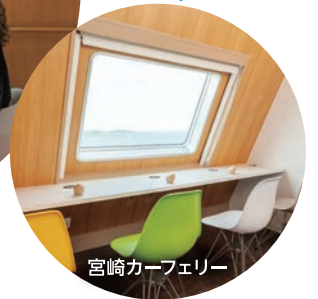
宮崎カーフェリー