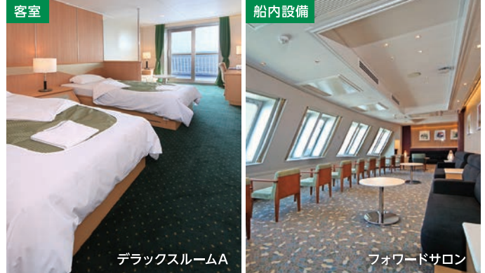
デラックスルームA