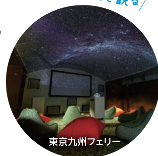
東京九州フェリー