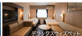
デラックスソファ