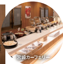
宮崎カーフェリー