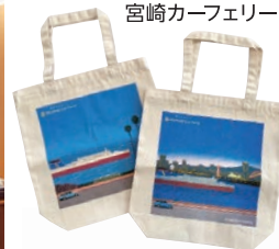
トートバッグ 宮崎カーフェリー