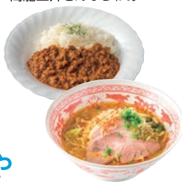
えび味噌ラーメン 新日本海フェリー