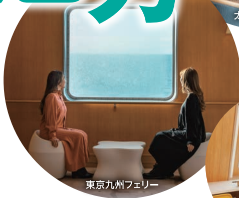
東京九州フェリー