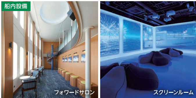
フォワードサロン